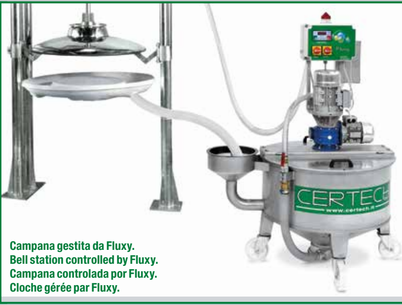
Campana gestita da Fluxy. Bell station controlled by Fluxy. Campana controlada por Fluxy. Cloche gérée par Fluxy.