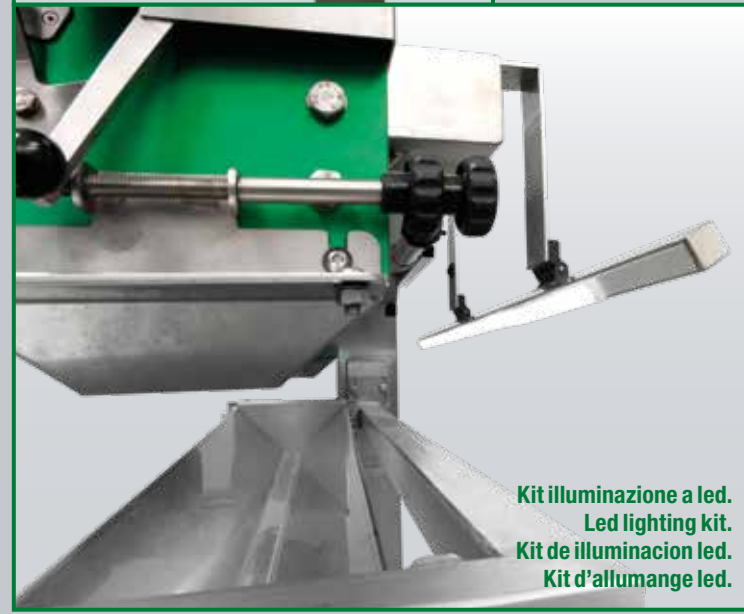
Kit illuminazione a led. Led lighting kit. Kit de iluminacion led. Kit d'allumange led.